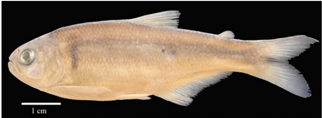
Fig. 1. Bryconamericus arilepis sp. nov. (Holotipo), male, 68.867 mm LE. Colombia, Santander, Charalá, vereda La Pontesuela, Magdalena medio.